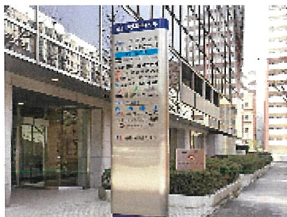
玄関横通用口(7:30～20:00)の入館経路... ①