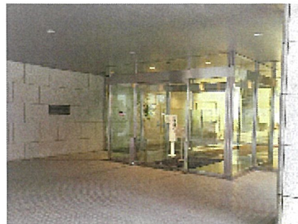
⑥正面玄関入り口は、平日・土曜日8:00～18:00(日祝日閉鎖)の時間帯でご利用頂けます。また玄関横通用口・裏口からお入り頂けます。