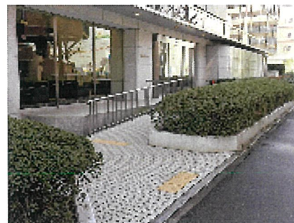
玄関横通用口(7:30～20:00)の入館経路... ③