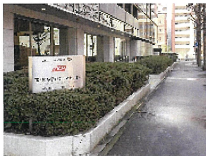
玄関横通用口(7:30～20:00)の入館経路... ②