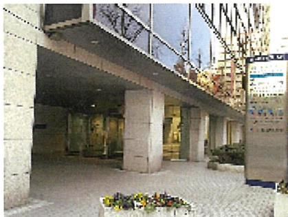
⑤こちらが正面玄関でございます。会場は8階となっておりますので、エレベーターでお上がり下さい。